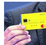
I CONTI PUBBLICI Corsa al reddito di cittadinanza: boom di cambi di residenza a Napoli di Valerio Esca