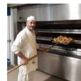
LAVORO C'È Panettiere offre lavoro a 1.400 euro al mese: «I giovani non vogliono lavorare di...»