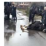
LA STORIA Funerale, nozze e fuochi ... si muore