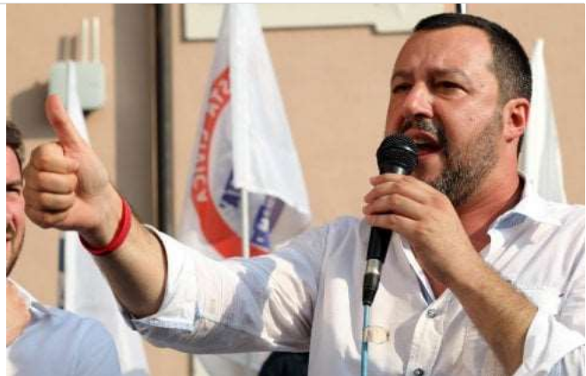
Matteo Salvini

Il suo post fatto durante la campagna elettorale era diventato virale. Criticava i toni usati dal leader Carroccio: "Mia figlia di 7 anni mi chiede, 'ma se vince quello che parla male di noi mi rimandano in Africa?'"