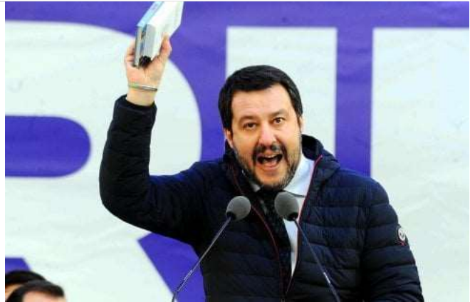
Matteo Salvini giura fedeltà al Vangelo in piazza Duomo

Incredula la donna: "Paradossale, sarei io quella che incita al razzismo?". Il leghista risponde: "Allor delinquenti e spacciatori, non certo i bambini"